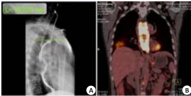
图1 上消化道造影及PET-CT(术前)

Fig.1 Results of postoperative esophagogram and PET-CT. A: Esophagogram revealing thoracic esophagus with a filling-defect measuring 18.3 cm in length; B: PET-CT showing a huge hyper-metabolic mass in the mediastinum with aspiration pneumonia in the right lower lung but no evidence of distant organ metastasis.