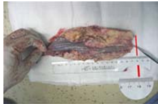
图3 肿瘤标本大体观

患者系来自上海的音乐人,嗜酒及咖啡20年,每日饮酒及咖啡均超过500 mL。不良生活方式是患者罹患食管癌的主要诱因 [6] ;患者短期内即出现吞咽困难、吞咽痛、饮水呛咳及声音嘶哑。此外待至入院后第3天,患者已无法继续饮水。这提示了食管梗阻和淋巴结压迫喉返神经的可能;患者气管膜部和胸主动脉已受肿瘤侵犯(但尚未侵入)。我们预测患者在近期内发生食管气