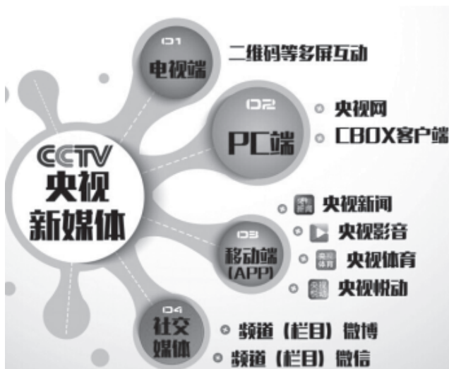
图4 央视新媒体多屏传播平台示意图

因此，传统媒体与新媒体的融合，必须要考虑到各自实际，发挥自身优势，打造有特色的内容。