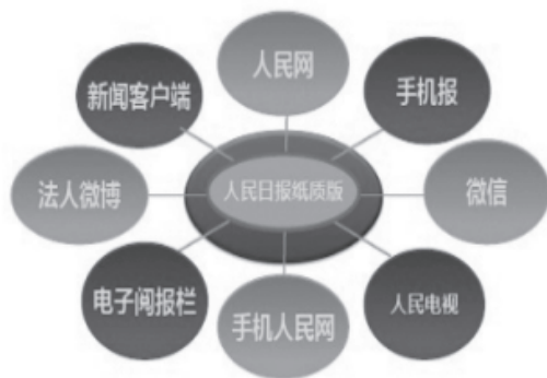
图1 人民日报全媒体传播矩阵

自微信公众平台推出后，立刻显露媒体属性，并以其独有的优势引领新媒体传播大潮，企事业单位、社会组织、媒体和个人纷纷注册公众账号，进行信息推送。包括微博、客户端等不同的信息传播平台也风生水起，成为媒体融合的强大助推力，许多传统媒体通过结合新的传播手段，关注量都以百万甚至千万级展现，形成强势的传播矩阵。