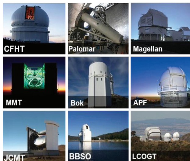
图5 TAP所用的光学、红外望远镜和亚毫米波(JCMT), 太阳(BBSO)和时域望远镜(LCOGT)

专项虽然目前进展良好,但本专项涉及人员与其他专项相比,人员较多,涉及多个单位,同时吸纳了约15%的高校人员,在管理上具有一定的挑战性。专项