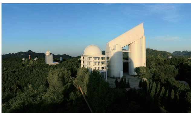
图4 LAMOST (郭守敬) 望远镜

构(包括暗晕子结构以及吸积历史)。这一模拟结果提供了一个有效的平台,让科研人员能够之后开展系列工作,深入研究星系形成中的重子物理过程,最终对星系的形成物理提供强有力的限制。